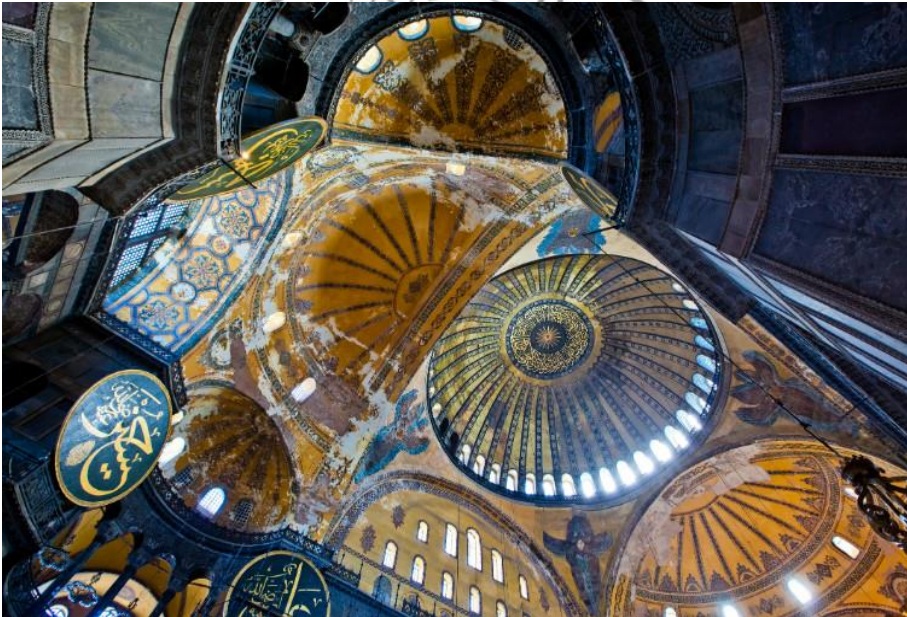
الشكل (٢) يوضح استخدام التكتيف في القباب والمقرنصات

وتتجلى قيمة الإغناء في الشكل والمعنى من خلال القبة الضخمة التي تظهر فوقها عقود كبيرة تحصر بينها المقرنصات التي تحمل قاعدة القبة، وتستند القبة من الشرق والغرب على أنصاف قباب ضخمة وترسو بدورها على عقود ودعامات سفلية تخفف الضغط على الجدران، القبة من الداخل مغطاة بطبقة من الرصاص لحمايتها من العوامل الجوية وتفتح في أسفلها النوافذ للإضاءة وتحتل الكتابات والزخارف الخطية التي تجلت باسم الجلالة والخلفاء الراشدين متخذة منها بعداً روحياً فضلاً عن بعدها الجمالي. كما موضح في الشكل رقم (٢).