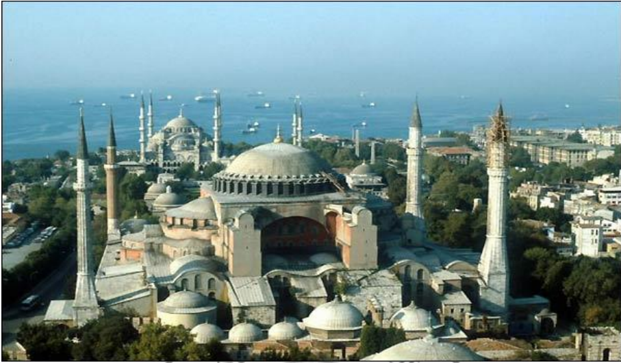
الشكل (١) يوضح العمارة الخارجية (آيا صوفيا)