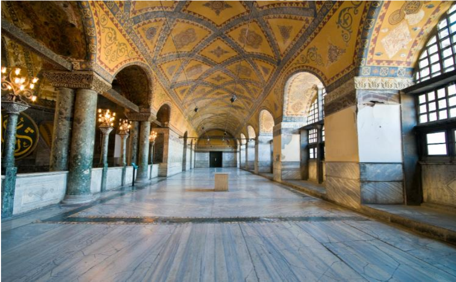
الشكل (٣) يوضح الإغناء الشكلي في الزخارف السقفية

ونجد ذلك بصورة واضحة من خلال طبيعة الزخارف ودقتها المنتشرة على سقوف الأروقة وطبيعة الألوان المستخدمة آنذاك والتي قاومت عوامل الزمن محافظة على رونقها، ولم يقتصر الإغناء في دقة التفاصيل حسب، وإنما نجده أيضاً من خلال انتشار الشبابيك التي تضيء بدورها بعداً جمالياً آخر من خلال إبراز دقة التفاصيل الشكلية في الفضاء الداخلي للمبنى، كما موضح في الشكل رقم (٣) و(٤).